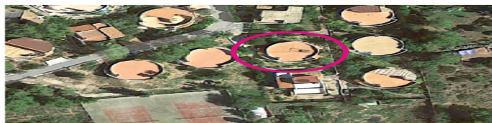
SITUATION_PLAN URBANISATION STELLA MARIS PARAISO